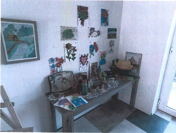
Fotografija broj 3 – proizvodi nastali tokom radno okupacione terapije

Nakon obilaska zapaženo je da su se u Domu organizovale razne manifestacije, edukativne i kreativne (koje zahtijevaju finu motoriku ruku) radionice, igranje društvenih igara.